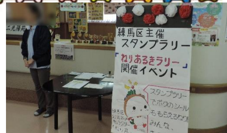
練馬区ねりあるきラリー

区内の福祉施設で、施設を利用する方やスタッフなどと交流し、地域での相互理解を推進するため、練馬区独立 70 周年記念事業のスタンプラリーに参画しました。光陽苑、第二光陽苑ともブースを開き、多くのお子さんや地域住民の方々に来苑いただきました。