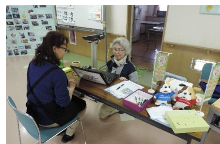
つながれ ひろがれ ちいきの輪

地域で「支える・支えあう」ことに取り組む法人として、東京の高齢者福祉施設による、地域によりそうキャンペーンに参画しました。光陽苑では、ボランティア団体による「陽だまり喫茶」、第二光陽苑では、地域交流の場として「秋祭り」、新町光陽苑では、地元町会自治会、地元消防署との「合同防災訓練」を実施しました。福祉や介護サービスが必要な高齢者だけでなく、地域で暮らす住民のお役に立ちたいとの思いで、イベントや交流会をこれからも開催していきます。